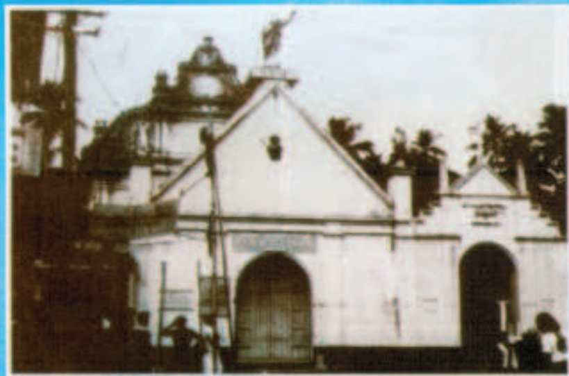
എവുപ്രാസൂയ തണുത്തുനിന്നു സാഹിത്യ എഴുത്തുകാരികൾക്കുമാത്രം കൈവരാത്ത (പുതുക്കിപ്പണിയുന്നതിനുവേണ്ടി)