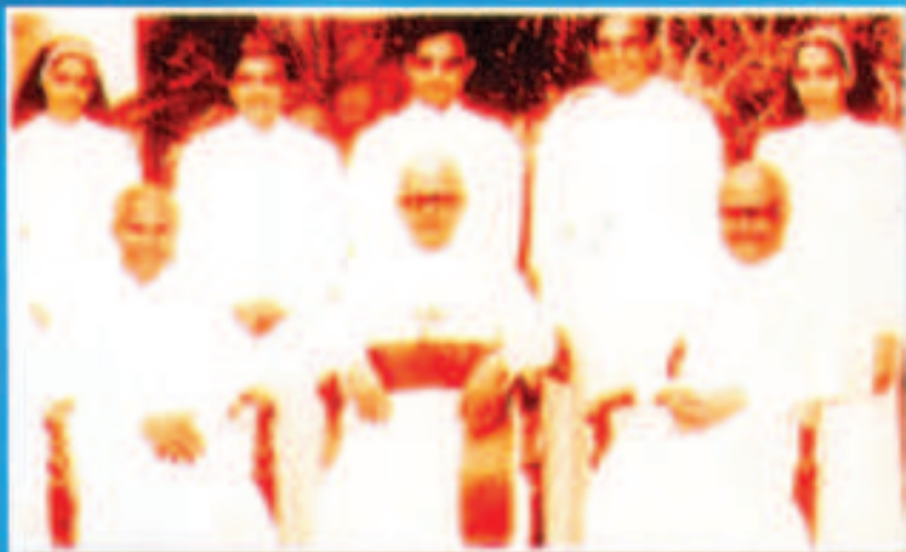
എവുപ്രാസുത്തയുടെ വീരോചിത സുകൃതങ്ങൾ പരിശോധിക്കുന്നതിന് നിയുക്തരായ തൃപതാഭരണത്തി അംഗങ്ങൾ