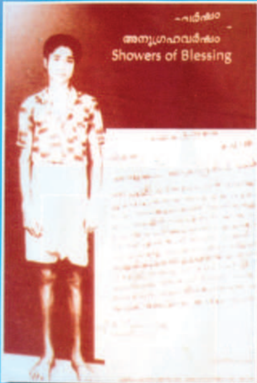
എവുപ്രാസത്യരുടെ മദ്ധ്യസ്ഥതയിൽ പട്ടുകാലുകൾ പൂർണ്ണമായും സുഖപ്പെടുത്തിയതിന്റെ സാക്ഷ്യം