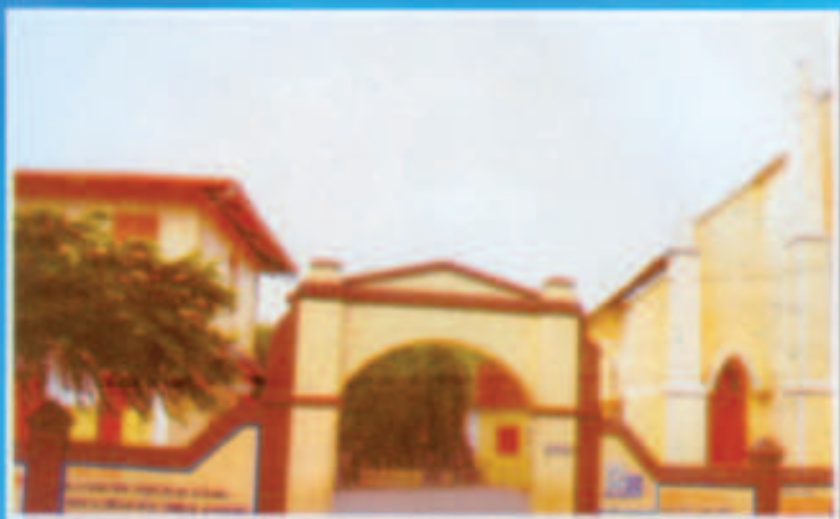
ശ്രീതീർത്ഥപാദ മഠം കോൺവെന്റ്