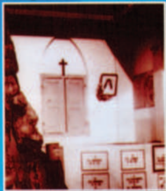
മണ്ണിൻ നെൽ മേന്മൻ മോക്ഷംവേണ്ടി ഏവ്യപാസ്യജന്മ ആദ്യം സഹസ്രകീഴ്ച പാത മണ്ണ