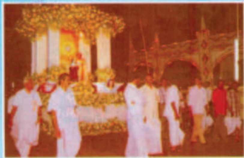
വാഴ്ത്തപ്പെട്ട എവുസ്രാസ്യയുടെ തിരുസമുപം ല്ലൂർ സെന്റ്. മേരീസ് കോൺവെന്റിലേക്ക് പ്രാക്ഷിണമായ്