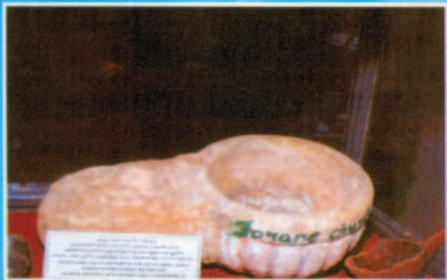
ഏവ്യപ്രാസാദം തിരുനെൽവേലൂ സമീപമുള്ള മാമ്മോദീസ തൊട്ടി (ഏടത്തിമുത്തി പഴയ പള്ളിയിലെത്)