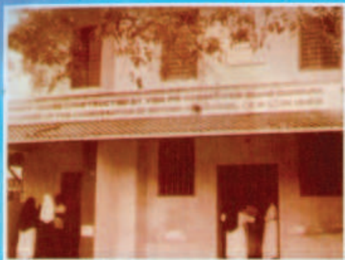
ചാവറ പീതാവ് സ്ഥാപിച്ച കുർമ്മലീത്താസഭയ്ക്കുവേണ്ടി, പീതാവ് തന്നെ പണിപെടുത്തിയ കുന്നത്താവിലെ ആദ്യകോൺവെന്റ്