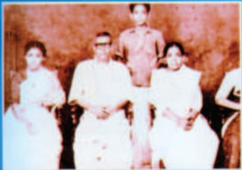
തീർപ്പിടിക്കുമ്പോൾ തന്നെ, ഏവ്യപാസ്യജന്മ പ്രാർത്ഥിച്ചു മോക്ഷംവേണ്ടി നിന്ന സുഖപ്രാപിച്ച മോമണി അമ്മയ്ക്കിടയിൽ വന്നിട്ടും കൂടുംതമ്പുര