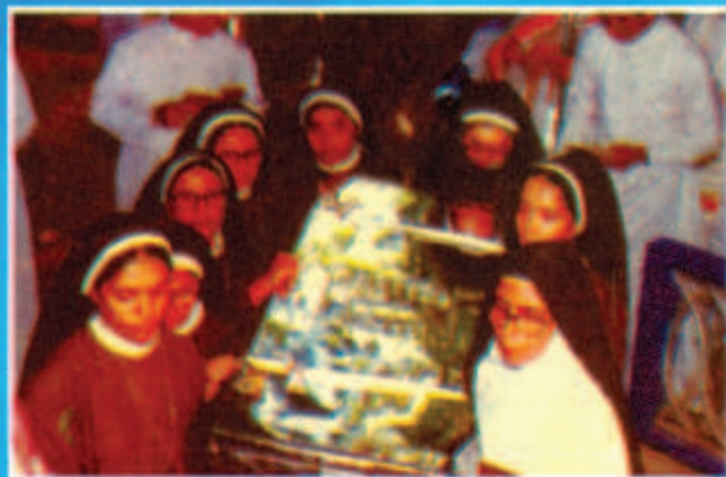
ആദ്യത്തെ കല്ലറ തുറന്ന്, എവുപ്രാസുത്തയുടെ അതികാവശിഷ്ടം പൊകത്തിലാക്കി സംസ്കരിക്കാനാണ് സിസ്റ്റേഴ്സ് ഓരോരാലത്തത്തിലേക്ക് കൊണ്ടുപോകുന്നു.