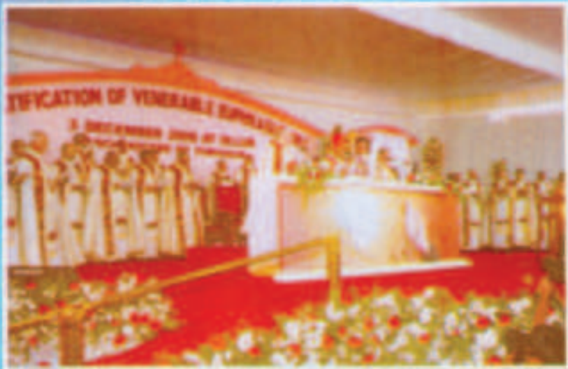
‘വാഴ്ത്തപ്പെട്ട’ എവുസ്രാസ്യം - പ്രഖ്യാപനരവരി