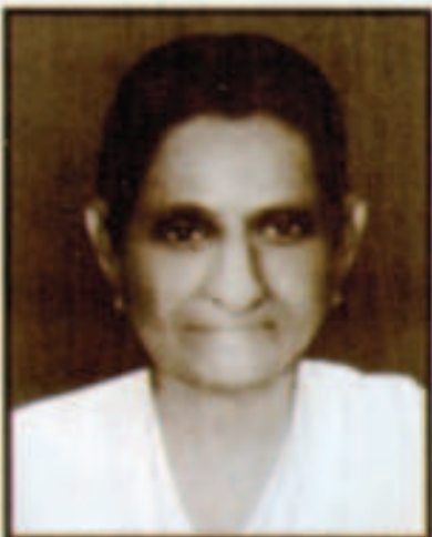
എമ്പുപാസ്കരുടെ മാതാവ് അരുണാട്ടുകര ചാലിയ്യേരി ഇട്ടിക്കുട്ടി പൊറിഞ്ചു മകൾ കുഞ്ഞമ്മ