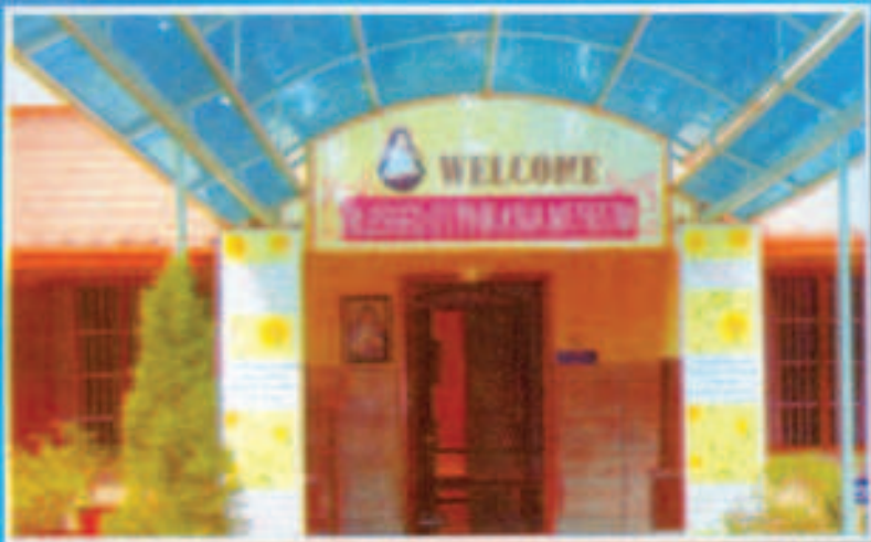
ഈജിറ്റ് ഏവർപ്രൊസ്പെക്ട് സെന്ററിൽ വാർത്തപ്പെട്ട ഏവർപ്രൊസ്പെക്ട് ക്യാമ്പിന്റെ പ്രവേശന കവാടം