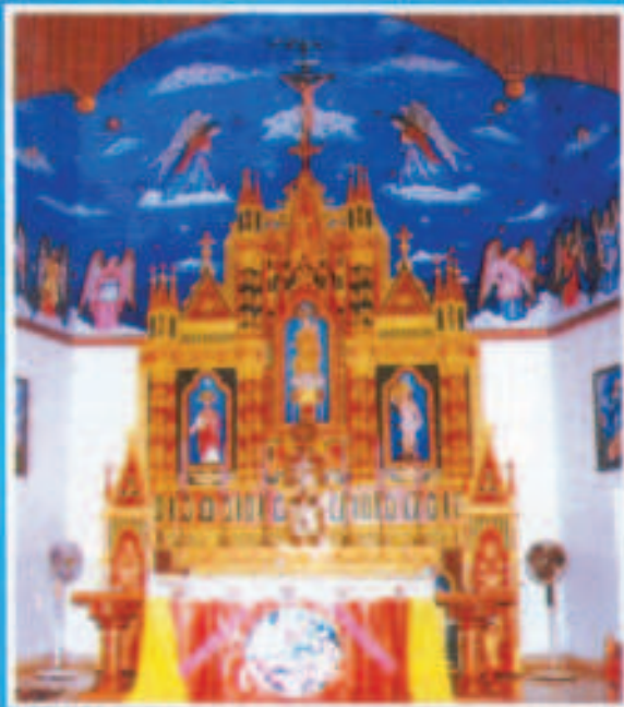
ഏടത്തിമുത്തി കാർഷൽമാതാ ഹോറോണ പള്ളി, മദ്രാസ്