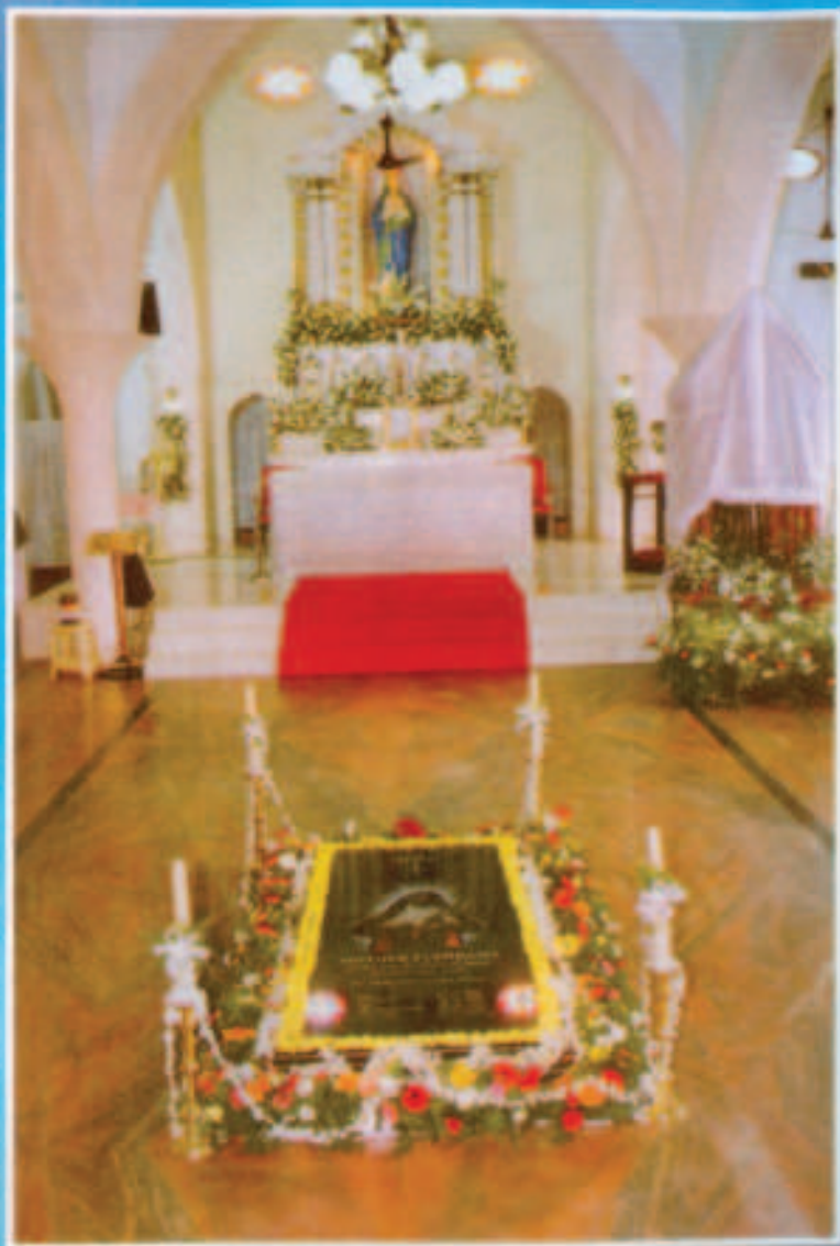
വാഴ്ത്തലപ്പെട്ട എവുപ്രാസ്യയുടെ കബറിടം ഒല്ലൂർ സെന്റ് തേരീസ് കോൺവെന്റ് ചെമ്പലിൽ