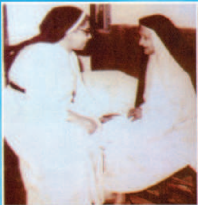
ഏവർപ്രൊസ്പെക്ട് ക്യാമ്പിന്റെ സോഫിസ്റ്റ് കിരണമിഷണറിയുടെ അടിസ്ഥാനപാഠ്യം