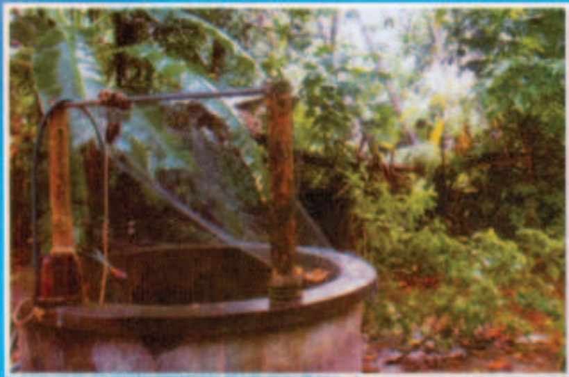
കാട്ടുതീർത്ത് എവുപ്രാസൂയയുടെ ജന്മസ്ഥലം ഉണ്ടായിരുന്ന സമയവും ശേഷിച്ചിട്ടുള്ള കിണറും.