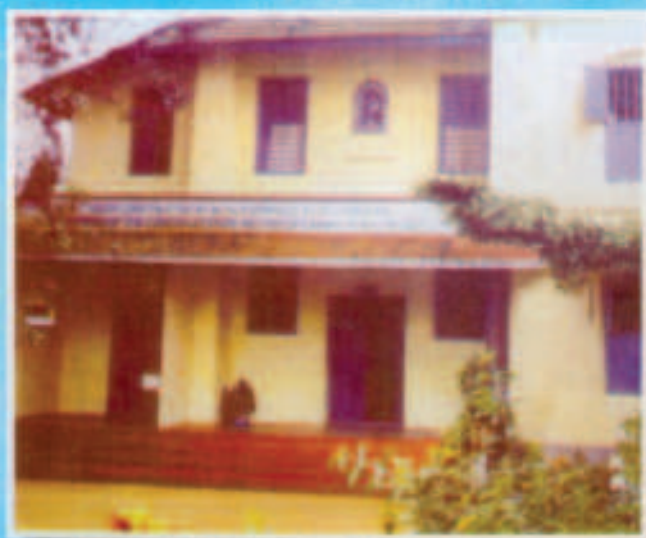
ഏല്യാവത്തികുൽ റോസ് (ഏല്യാപ്രാസഡ്) & വർഷം ജീവിച്ച കുന്നത്താവ് മഠത്തിന്റെ ബോർഡിംഗ്