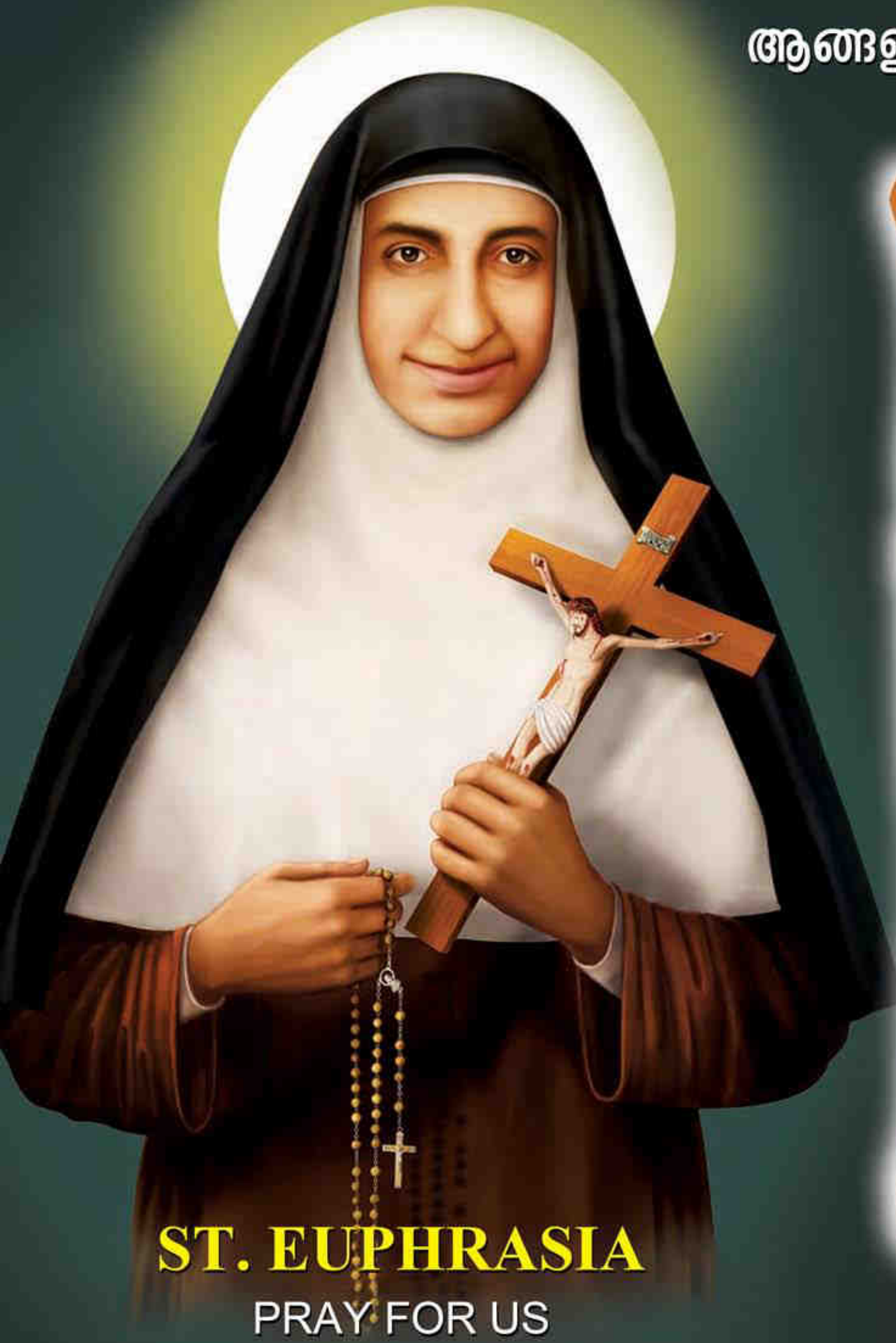
ST. EUPHRASIA PRAY FOR US